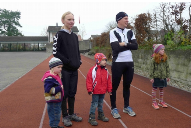
Die kleinen Zuschauer...