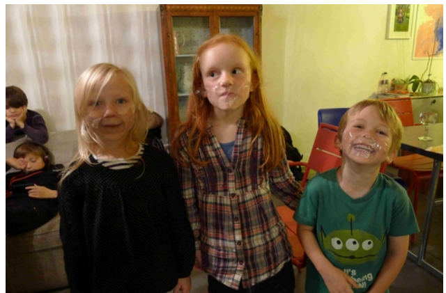
...kleben sich das Maul zu, dann ist Ruhe...