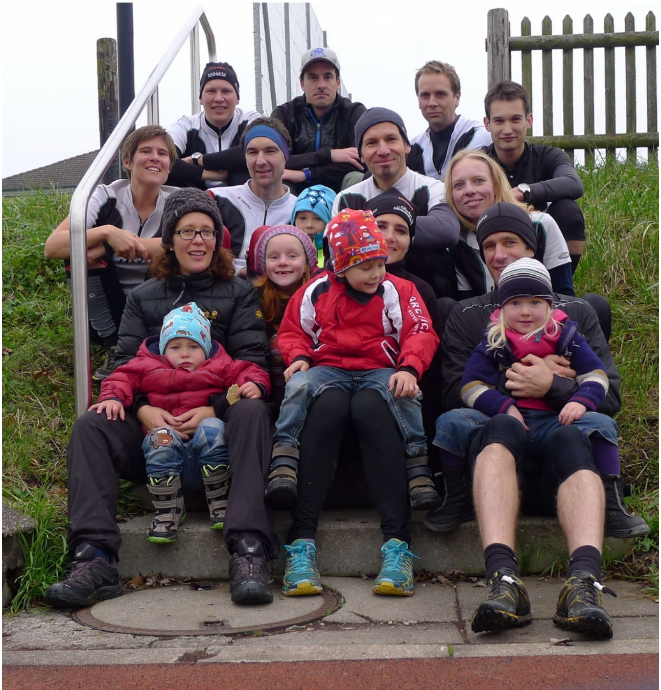
Gruppenbild ubol SM 2014