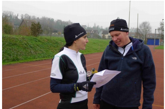
Und natürlich Strategie besprechen