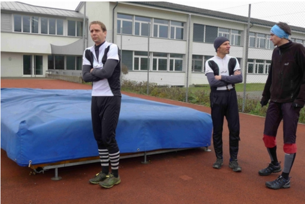
Frösteln zwischen den Läufen