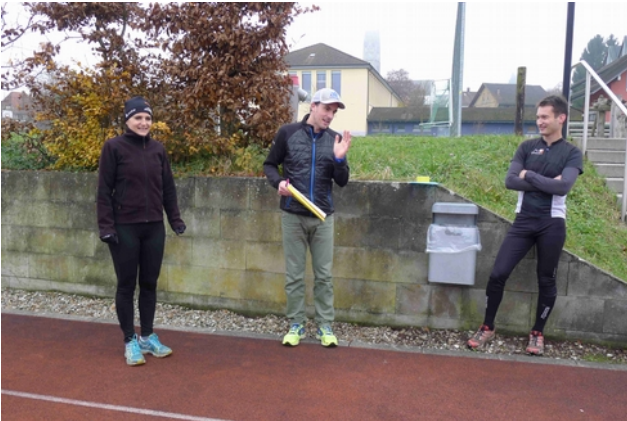
Anweisungen des Laufleiters